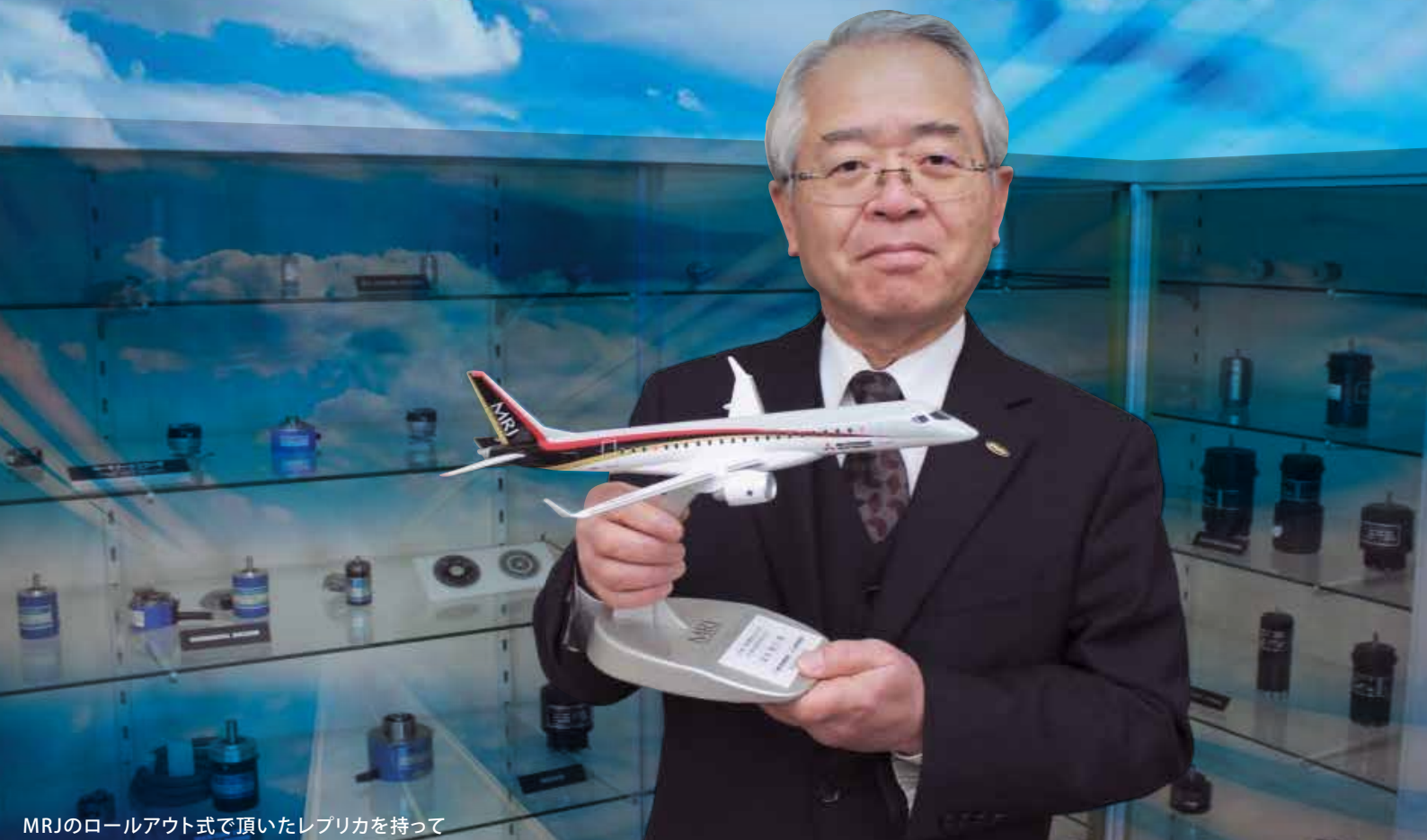
MRJのロールアウト式で頂いたレプリカを持って